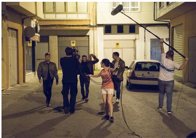
Rodaje "Media hora y un epílogo" en Veguellina de Órbigo