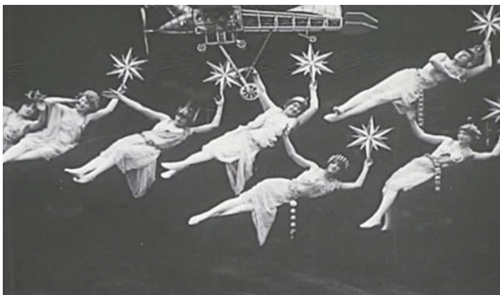
"Viaje a la Luna" de George Méliès, el mago del cine.